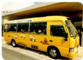
「さようなら！」 明日もみんなをまってるよ！」