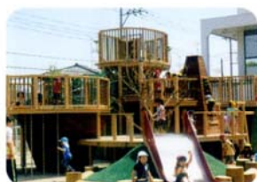
「おはようございます！」 えがおで今日がはじまるよ！」