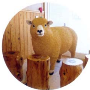
みんなのアイドル ひつじの羊子ちゃん