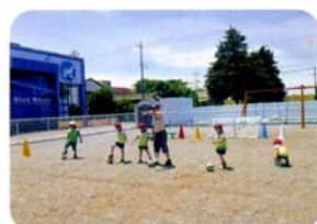
専属の先生によるサッカー教室 「サッカー選手になりたいなあ」