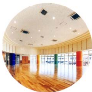
全面ガラス張り 見晴らしの良いホール

明るく元気で優秀な保育スタッフを揃え、子どもの自主性を尊重し、一人ひとりの個性を大切にしたい保育を行います。自由な雰囲気の中でリズム遊び、折り紙や工作などを行い創意工夫のできる力を身につけます。