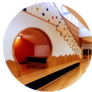
階段下にこっそり「洞窟」