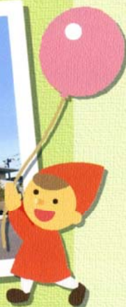
よるのくるみ幼稚園