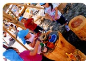
「砂あそびも、かけっこも ゼーんぶだいすき♥」