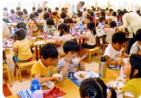
「みんなでなかよく いただきます★」