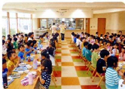
ランチルームにてみんなで 楽しく食事をします。