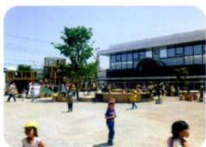
「広いお庭で元気いっぱい くるみの子😊」

明るく元気で優秀な保育スタッフを揃え、子供の自主性を尊重し、一人ひとりの個性を大切にした保育を行います。